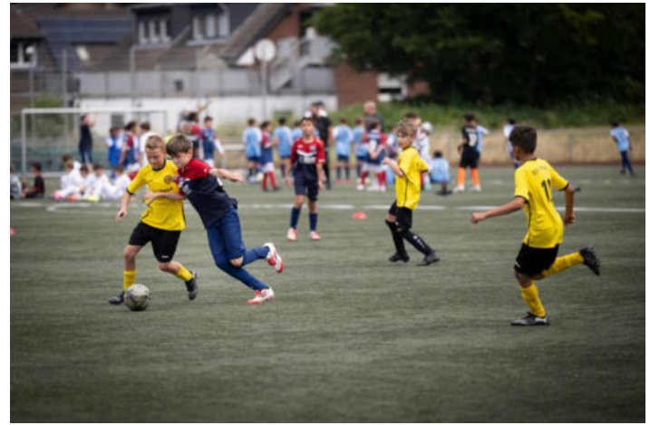
Gekämpft wird schon wie bei den Großen