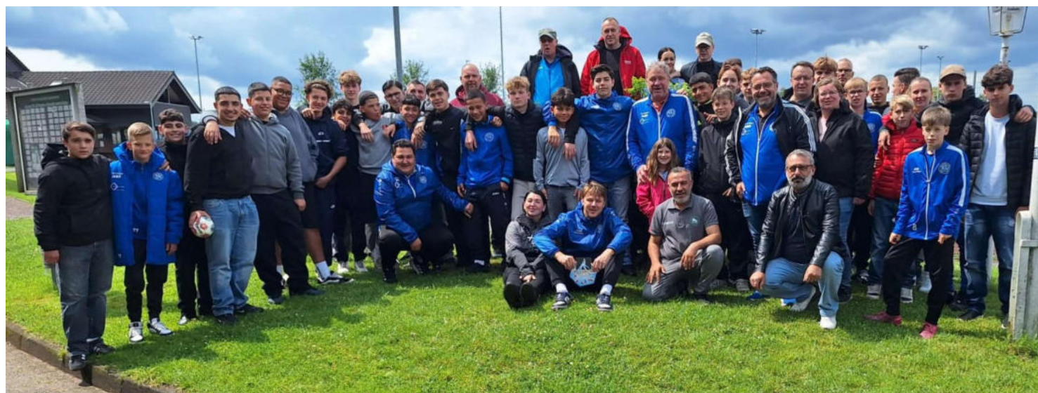
Die C1 Mannschaft im Trainingscamp

Eine Idee - ein Team - ein gelungenes Camp!