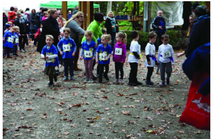
Alle sind konzentriert am Start. Die Eltern geben letzte Anweisungen an die Kinder

Durch diese Pause haben wir uns für einen neuen Modus in der Durchführung entschieden. Unter dem Motto „bewegende Menschen, bewegen Menschen“ findet der Lauf nun als Sponsorenlauf und nicht mehr als Zeitlauf um Sekunden statt. Konnten vorher nur trainierte Sportler an diesem Lauf teilnehmen, kann nun jeder mitmachen. Egal ob Kinder, Jugendliche, Erwachsene, Ältere, körperlich und geistig eingeschränkter Menschen, Rollstuhlfahrer oder Mütter mit ihrem Kinderwagen. Alle können mitlaufen und pro gelaufenen Kilometer einen Euro oder mehr spenden. Auch Zuschauer können mit einer kleinen Spende helfen. Alle Spenden gehen zur Unterstützung des ambulanten Hospizdienst Bethanien.