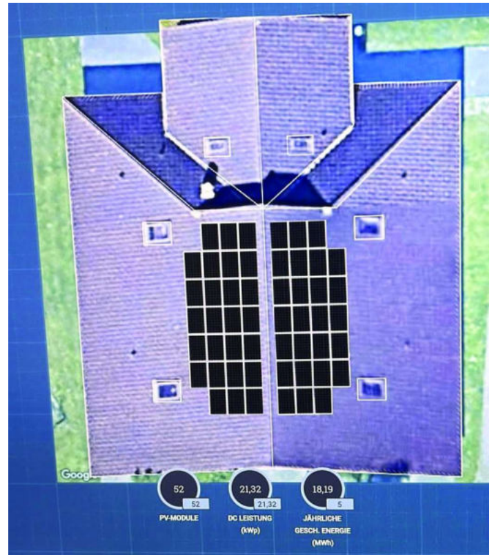
So könnten die Module am Neubau angebracht werden. Planung der Firma Wattgrün

Für den Neubau wird erwartet, dass es keine Beanstandungen zur Anbringung einer PV-Anlage geben und daher eine schnelle Umsetzung erfolgen wird.