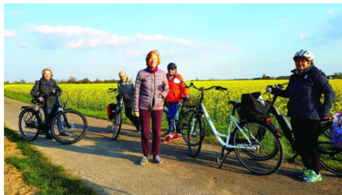
Eine der Fahrradtouren

Kommt doch einfach mal zum „schnuppern“, schaut Euch das an oder macht direkt die ersten Übungen.